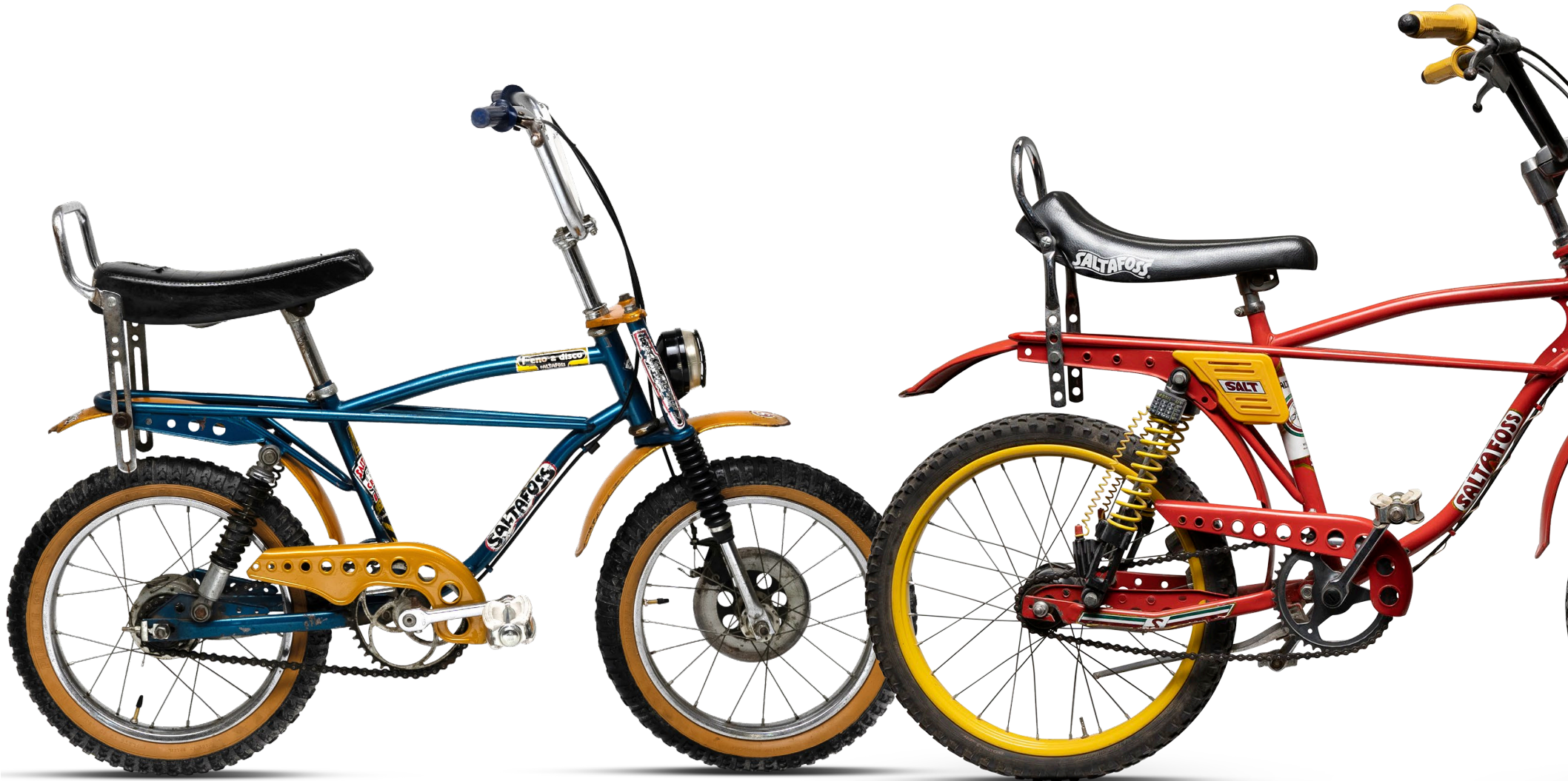
prima serie 1970 - 1980